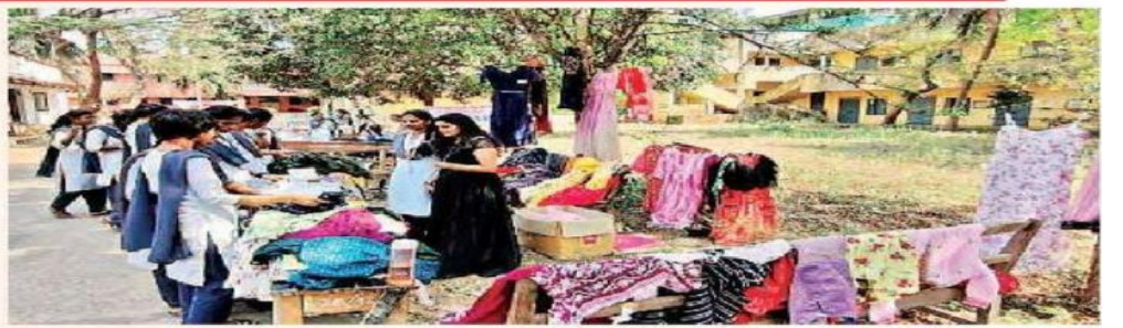
విద్యార్థినులు ఏర్పాటు చేసిన వస్త్ర ప్రదర్శన

రాజమహేంద్రవరం సాంస్కృతికం: కందుకూరి రాజ్య లక్ష్మి మహిళా కళాశాలలో మంగళవారం ఫియస్టా 2023 నిర్వహించారు. విద్యార్థినులకు వ్యాపార మెలకు వలు నేర్పించ