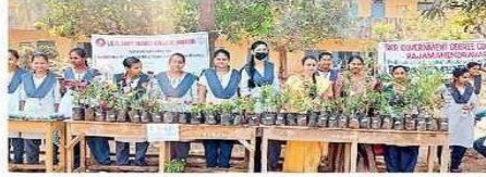
వ్యక్తిగత ఆధ్వర్యంలో విద్యార్థులకు పాఠాలు చేసిన సర్దిగ