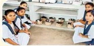
వందీస్తున్న పుట్టినాడులతో విద్యార్థులు