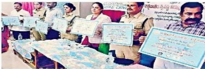
పోస్టర్ను ప్రదర్శిస్తున్న సభ్యులు