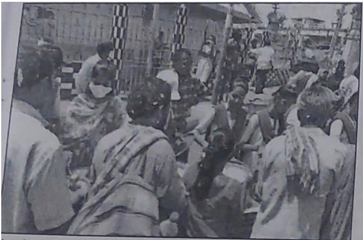
Charity - Food & Blanket to the Poor at Pushkar Ghat

Our college NSS Unit observed Poor and homeless people at Pushkar ghat , Our NSS PO's and volunteers went there and distributed them food and clothes. 35 students participated.