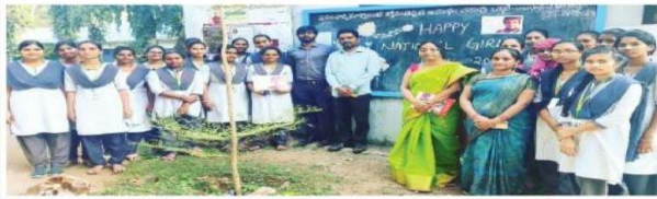
ఎన్కెఆర్లో ఘనంగా బాలికా దినోత్సవం

National Girl Child Day was observed by the Department of English to raise awareness about rights of the girls and to providesupport and opportunities and the importance of education. Students enjoyed the programme and shared their views. Chocolates were distributed to the students.